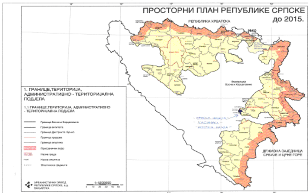
Приказ Града Источно Сарајево: